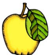
_____ pomme _____

Inscris les noms corrects sous les images !