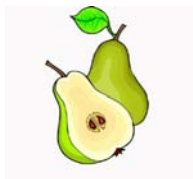
_____ poire _____