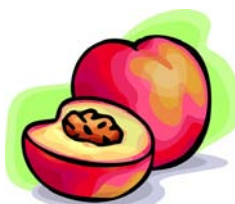
_____ pêche _____