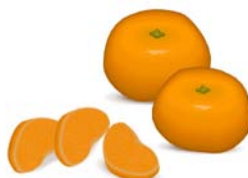
_____ mandarines _____