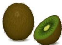
_____ kiwi _____