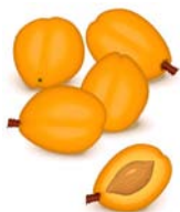
_____ abricot _____