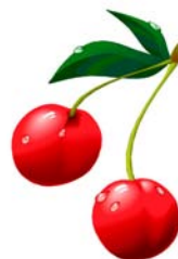
_____ cerise _____