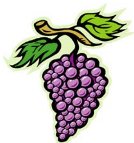
_____ raisin _____