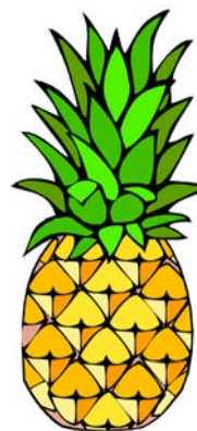
_____ ananas _____