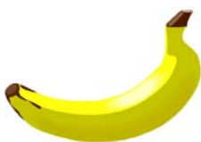
_____ banane _____