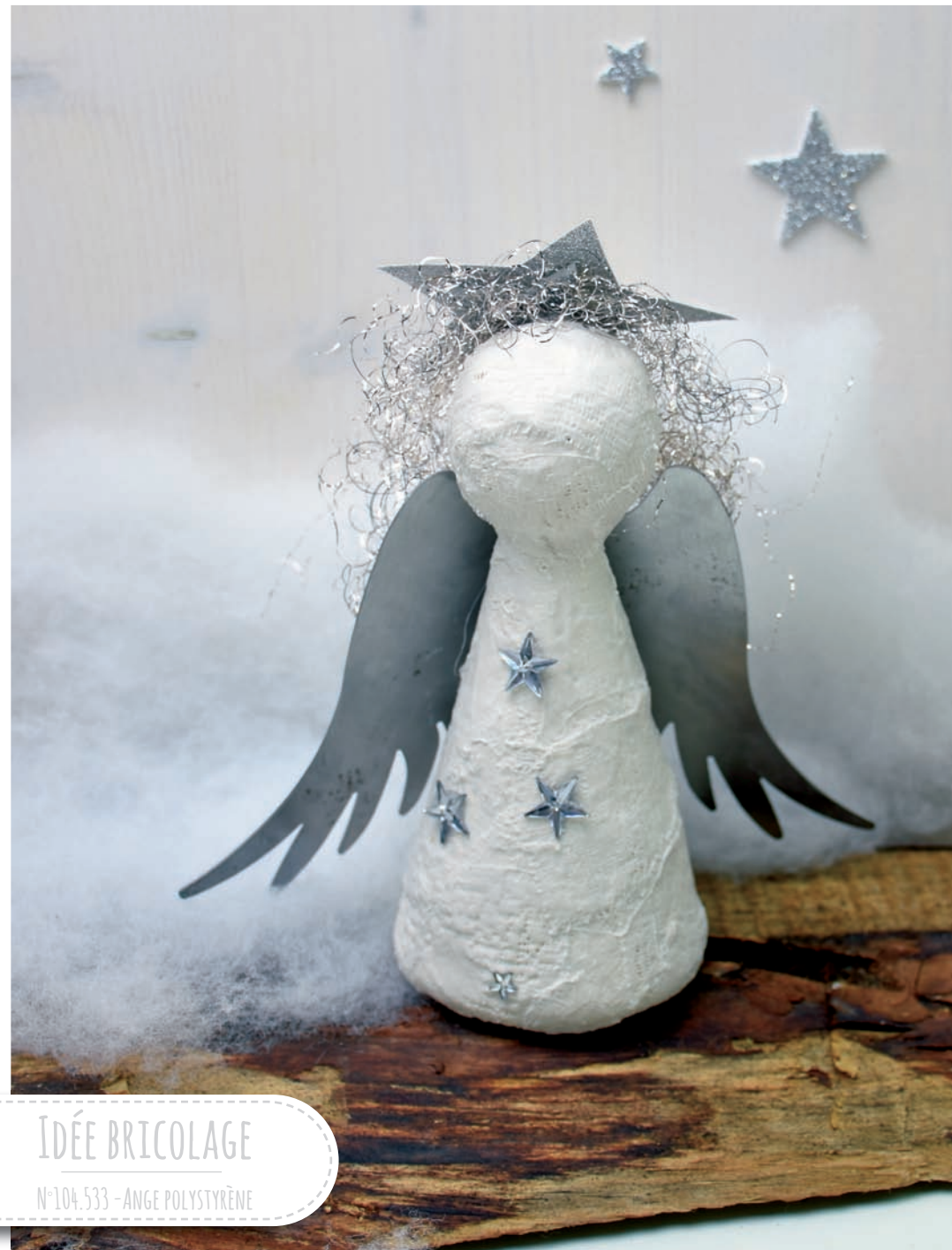
IDÉE BRICOLAGE N°104.533 - ANGE POLYSTYRÈNE