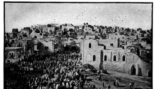
So sah Bethlehem 1894 aus.

Damit es spannend bleibt, könnt ihr euch dann auch neue Spielregeln und Ereignisse ausdenken!