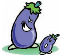
groß - klein