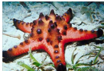
étoile de mer