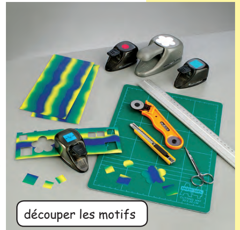
découper les motifs

Step 1 Sur le Color Décor, dessine ou découpe des carrés, des rectangles ou des fleurs. Vérifie bien que les dimensions que tu utilises sont les bonnes et que tes rectangles correspondent bien aux dimensions des bords de ta boîte. Pose une règle afin que les formes restent bien droites. Pour découper, tu peux utiliser soit des ciseaux, soit un cutter. Tu peux également prendre un motif de ton choix.