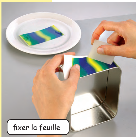
fixer la feuille

Step 2 Maintenant tu trempe brièvement le motif dans l'eau jusqu'à ce qu'elle se décolle de son support. Puis tu fixes le motif sur la boîte et tu lisses avec un papier essuie-tout, de l'intérieur vers l'extérieur.