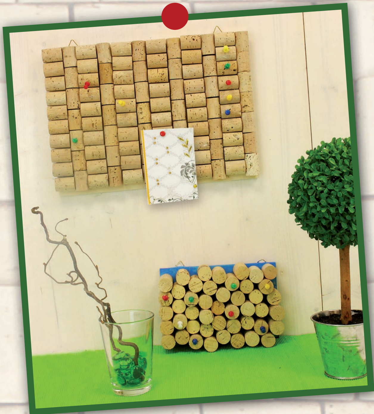
Tableau d'affichage en bouchons - liège