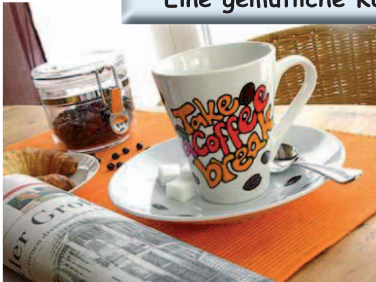
Eine gemütliche Kaffeepause