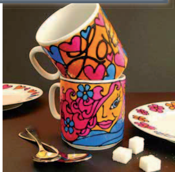
Für Junge und Jungverliebte